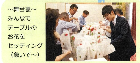
～舞台裏～ みんなで テーブルの お花を セッティング (急いで～)

ご来賓・協力会社の代表の方々をご紹介します。ご多用の中、大勢の方々にご参加くださいました。心より感謝申し上げます。