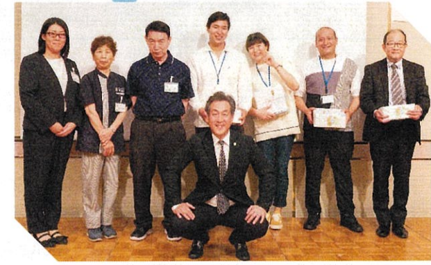
シーズンベストクリーンパートナー賞・MVP賞 ベストサイト賞の受賞者