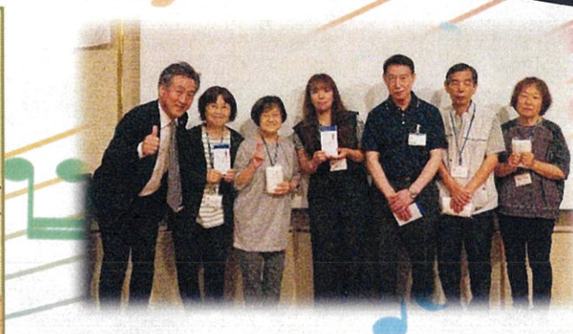
スマイル宝くじ抽選会にて1万円の商品券が3名の方に当たりました。その他の方にも参加賞が