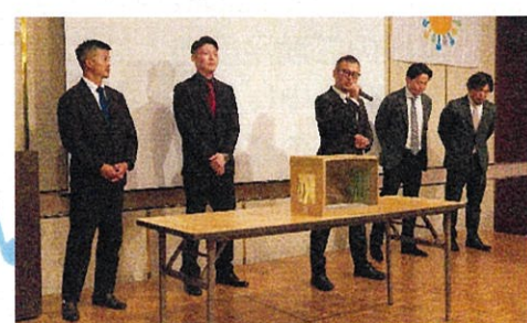
本社・東京の協力会社皆さま これからゲームに参加です