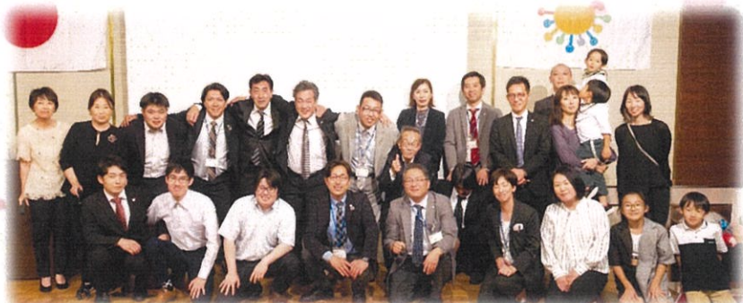
社員との思い出の一枚