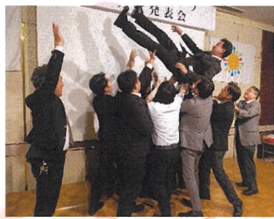
社員一同からの胴上げ くれぐれも落とさないでよ