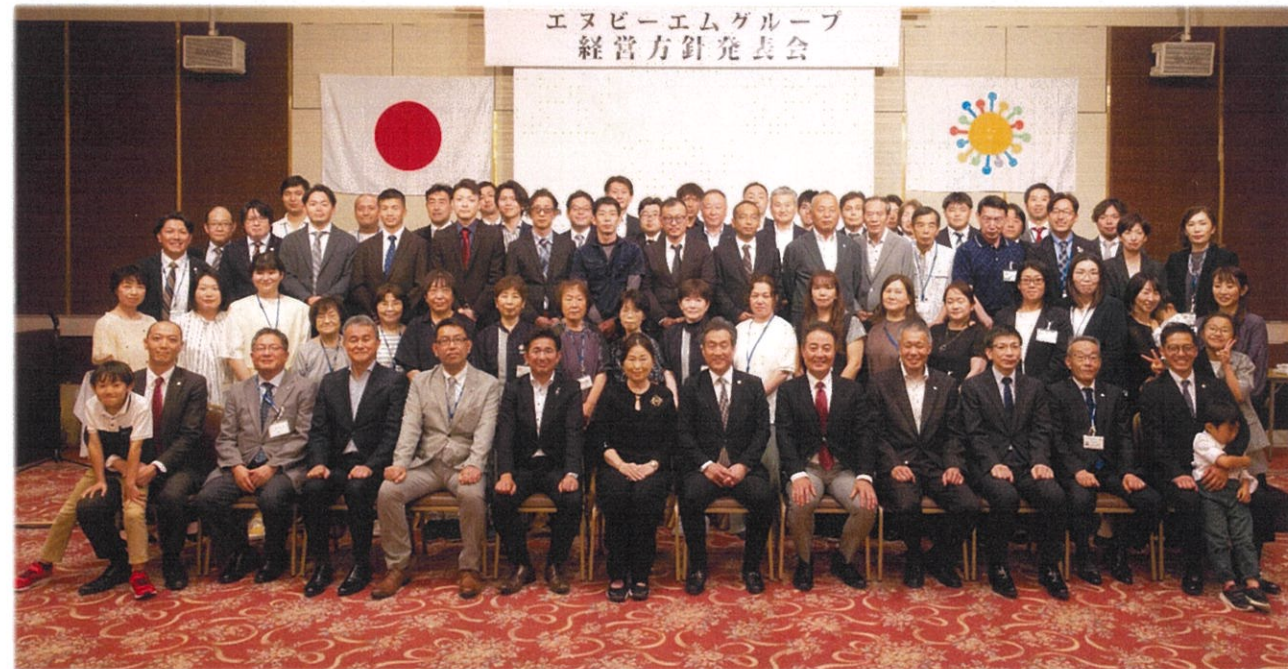
第28期経営方針発表会集合写真