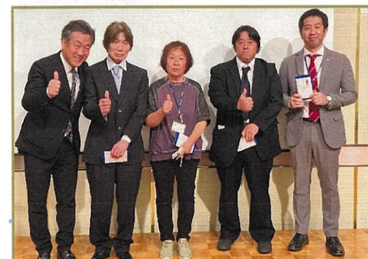
功労者賞の表彰式