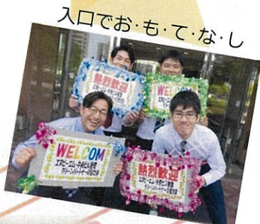
入口でおもてなし

6月16日にエヌビーエムグループの経営方針発表会を開催しました。今年も、クリーンパートナーはもちろんご来賓及び県内外の協力会社の方々にご出席くださいました。また、恒例の余興も笑いあり、涙ありでみなさんに楽しんでいただけたようです。一部ですが、その時の様子をご覧ください。掲載出来なかった方ごめんなさい🙏