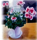
施設の部屋に飾られています