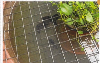
仲がいいんですよ

第十弾！今回のうちのほっこりファミリーは新將軍様です。 新しく昇格した將軍様で、黒目金チビを支配下にしています。 (残念ながら、先代の將軍様は天寿を全うされました) 支配していますが、餌をあげるとチビを優先に食べさせるイイ奴なんです。