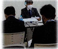
社長より今期の経営方針についての説明

『新たな市場を構築し、顧客や地域社会の負託に応えると共に、すべての社員家族が誇りとやりがいを持ち、わくわくしながら成長できる幸せな会社を創る』