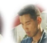
森部長 顔がシャブよ