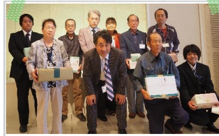
各賞を受賞された方々とのショット