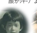
香川さん 面影あるよ