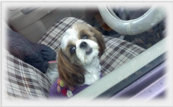
今から大好きなドライブワン♡