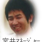
宮井マネージャー 何年前かしら？