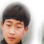
社長 この頃の夢は すでに歌手？