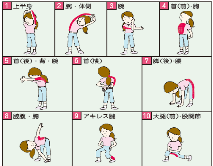
伸ばす部分を ■■■■■ で示しています。この部分に意識を集中させて伸ばしましょう。