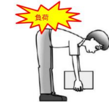
好ましくない姿勢