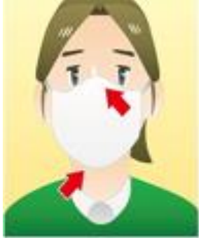
①マスクを着用し 口・鼻を覆う

コロナウイルスに限らず、くしゃみや咳が出るときは、飛沫にウイルスを含んでいるかもしれませんので、次のような咳エチケットを心がけましょう。