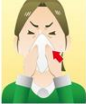
②マスクがない時 ティッシュなどで 口・鼻を覆う