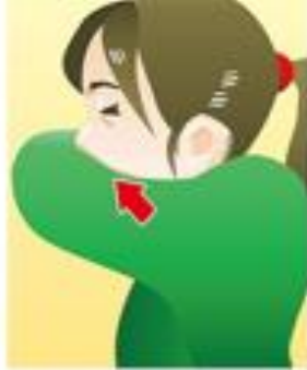
③とっさの時 袖で口・鼻を覆う

※「何もせず咳やくしゃみをする」はもちろんNG! 「咳やくしゃみを手でおさえる」もその手でいろんな場所を触ることが接触感染の原因となります。